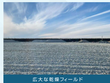
広大な乾燥フィールド